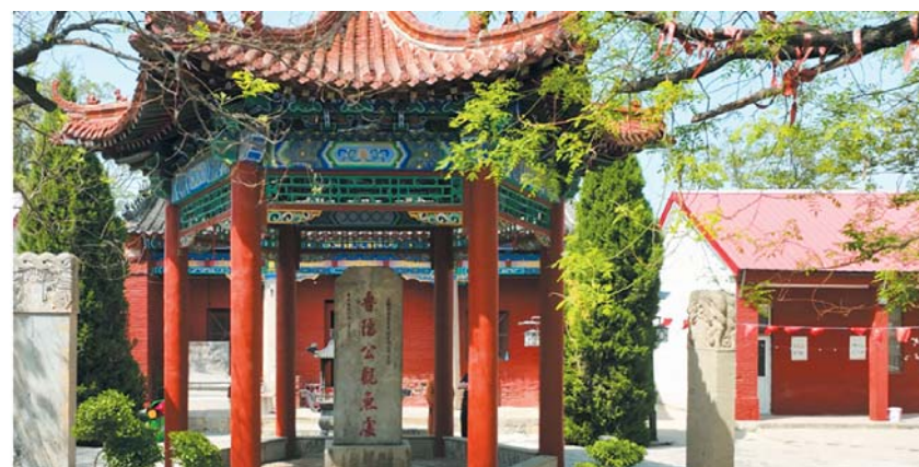
鱼台鲁隐公观鱼台

明洪武三十一年(1398年)，在原文登县境内设立威海卫，取“威震海疆”之意。当时的威海卫与天津卫、金山卫、镇海卫并称为“四大名卫”，并成为清朝北洋水师的驻扎基地。