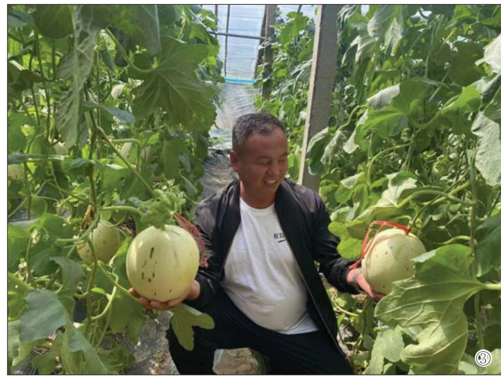
①、莘县(燕店)香瓜文化节暨“莘县香瓜30年”庆祝大会召开。 ②、30年的发展，莘县香瓜种植面积已达16万亩。 ③、莘县香瓜有效带动了群众增收致富。