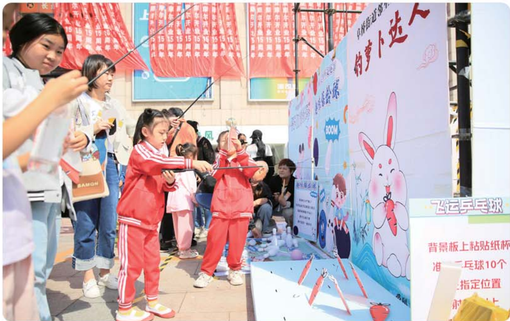
居民们在“邻里文化节”上参与互动游戏。

每月常态化开展公益集市的热闹场景,都深深烙印着党建引领、信用赋能的印记,增强了居民与企业的社区认同感与归属感。