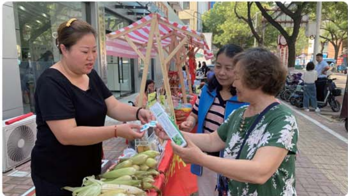
居民用信用积分在幸福集兑换商品。