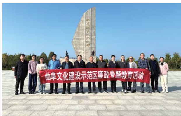
示范区组织党员干部在铁道游击队纪念碑前合影。

史，感受着烽火硝烟的峥嵘岁月，继承弘扬“赤诚报国、不怕牺牲、机智灵活、勇于亮剑”的铁道游击队精神，不忘初心、牢记使命。