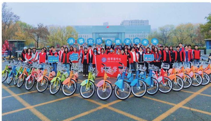
济宁医学院组织开展蓝丝带骑行志愿服务活动。

层倾斜,配齐配强“双带头人”教师党支部书记,落实好基层党建工作联系点制度,推动各级党组织班子成员定期深入联系支部,常态化调研指导工作,倾听师生诉求、解决实际问题。