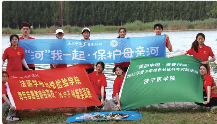
济宁医学院“青测”小河创新实践项目。