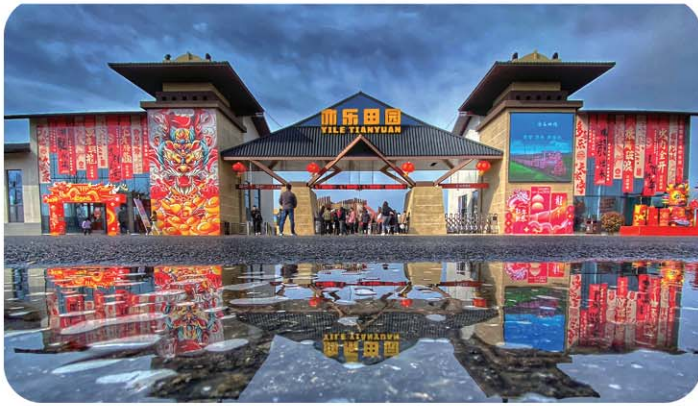
合伙人项目“亦乐田园”。