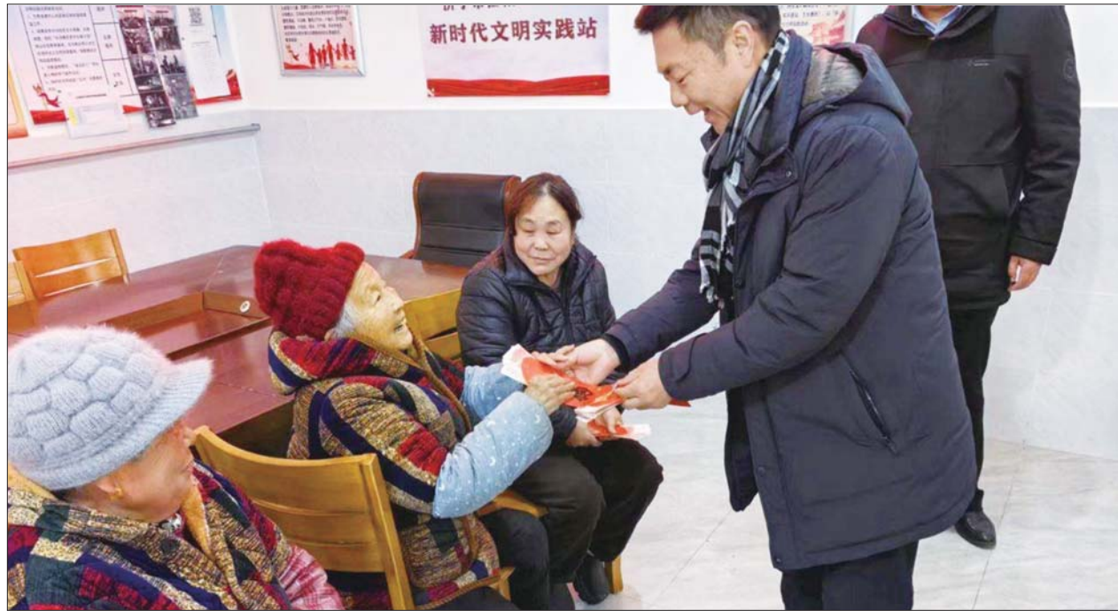
开展慰问老人活动。

在济宁市任城区长沟镇，一股由党建激发的乡村振兴热潮正涌动。长沟镇“河畔农耕”乡村振兴片区联合党委，以其独特的“党建为水育人才，结网捕鱼促繁盛”发展经验，构建起“四个一”发展策略，将昔日的乡村发展困局，转变为产业兴旺、村民富裕的生动实践，绘制出一幅乡村振兴的崭新画卷。