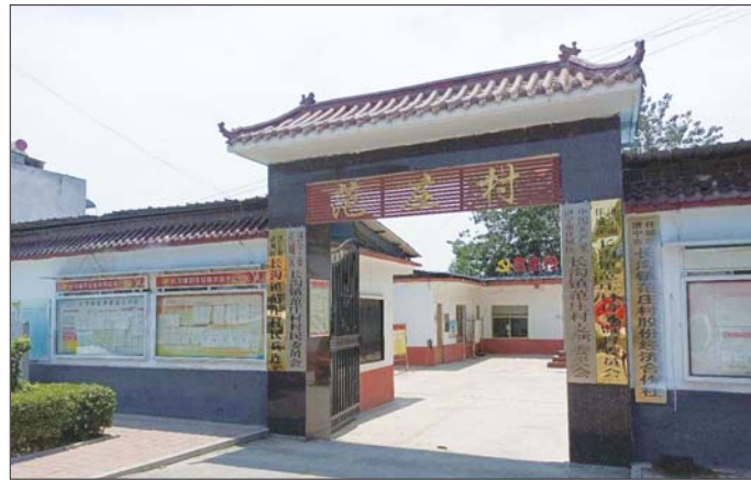
党支部成党建引领主力军。

长沟镇“四个一”结网链企，助力乡村振兴的成功实践，为济宁市乃至全省的乡村振兴工作提供了可复制、可推广的“长沟经验”。未来，长沟镇将继续深化“党建为水育人才，结网捕鱼促繁盛”的经验做法，让乡村振兴的成果惠及更多百姓，绘就更加美丽的乡村新图景。