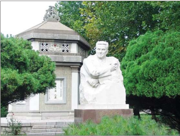
临沂华东革命烈士陵园汉斯·希伯墓雕像

1963年10月，汉斯·希伯的墓再次由抗日山迁至临沂的华东革命烈士陵园。次年，中共临沂地委为汉斯·希伯修建了水泥雕塑的六角亭状墓陵，墓高9.4米，正面题写“国际主义战士太平洋学会记者希伯同志之墓”。墓前为希伯的大型汉白玉质半身坐像，高