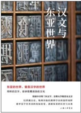
《汉文与东亚世界》 [韩]金文京 著 上海三联书店