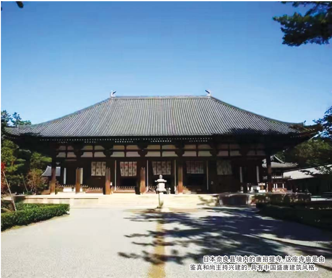
日本奈良县境内的唐招提寺。这座寺庙是由鉴真和尚主持兴建的,具有中国盛唐建筑风格。