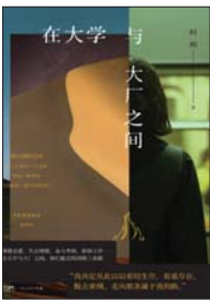
《在大学与大厂之间》 阿痴 著 乐府文化 | 广东人民出版社

十七岁那年,因为高考失利,阿痴失去了去“沙漠观测站”成为一名记录星类轨迹的天文学工作者的理想,困于精神危机中。失去了理想的阿痴承受着夜夜胃痉挛的绞痛,她躲进小说的世界中,