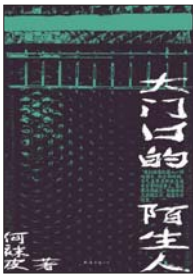
《大门口的陌生人》 何祎皮 著

从1913年到1922年普鲁斯特去世,塞莱丝特·阿尔巴雷一直是马塞尔·普鲁斯特的女管家。除了照顾他的起居,她也融入了他的隐居生活,甚至实质性地参与了《追忆逝水年华》的写作(普鲁斯特长度惊人的“纸卷”手稿即是在塞莱丝特的帮助下完成的,她也是小说《追忆逝水年华》中法兰索瓦丝这一角色的原型之一)。她一直守护着普鲁斯特,直到他生命的最后一刻。在塞莱丝特晚年,作家乔治·贝尔蒙协助整理了她的口述回忆,于1973年出版了《普鲁斯特先生》一书。通过柯林娜·梅耶对文字的精妙编排和史丹芬尼·马奈尔的传神插图,我们跟随塞莱丝特走进作家在奥斯曼大道和阿姆兰街与世隔绝的寓所,领略普鲁斯特令人难以置信的生活方式。从随时待命的厨房到贴满软木的卧室,从熏蒸治疗到考究的咖啡做法,我们目睹了普鲁斯特女管家的日常工作,并与普鲁斯特闲谈,和他一同出游,以及协助他完成艰巨的写作任务……一个异样而迷人的个人世界连同诞生于其中的传世名作,在塞莱丝特的讲述中缓缓形成。