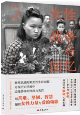
《女性,战争与回忆:35位重庆妇女的抗战讲述》 [美]李丹柯 著 重庆出版社

这是一部聚焦抗战时期女性生存状态的口述史著作,通过对多位经历抗战时期女性的采访,真实展现宏大历史背景下个人的遭遇与苦难。