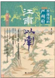
《江南以南:被湮没的严州府》 杨斌 著 火与风 | 上海译文出版社

近几十年,中国历史的研究中,学术界讨论的江南,狭义上说,指镇江以东的江苏南部和浙江北部地区,其中杭州府居于最南面,而严州,恰在杭州以南。在近两千年的历史