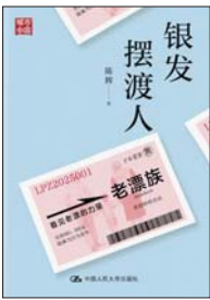
《银发摆渡人》 陈辉 著 中国人民大学出版社

“老漂”指从外地来到其子女所在城市,帮子女照顾孩子、做家务的老人,是青年家庭的摆渡人。亲眼看到自己的父母帮助带孩子和做家务,陈辉深感这种父辈支持模式在青年家庭中的关键