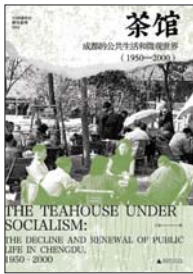
《茶馆:成都的公共生活和微观世界(1950—2000)》 王笛 著 大学问 | 广西师范大学出版社

本书为学者王笛新作,《茶馆:成都的公共生活和微观世界(1900—1950)》姊妹篇作品。作者通过考察20世纪下半叶成都的茶馆,探究大众文化以及公共生活的兴衰起伏,从而透视中国社会半个世纪的剧变。书中,作者将历史人类学和社会人类学的方法结合起来,利用档案材料及田野调查,聚焦茶馆业主、顾客、艺人、掏耳匠等人物,以白描的手法勾勒他们在茶馆这一公共空间的喜怒哀乐与命运抉择,从而展现出一幅饱满、立体的城市生活图景。通过本书,人们不仅可以看到城市的发展及其逻辑,还可以从这些细节背后,重新触摸一座城市的历史与记忆,理解当代中国的转型与变迁。