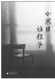
《小寒日访程爷》 张翎 著 新民说 | 广西师范大学出版社

本书是作家张翎最新现实主义小说集,包括《小寒日访程爷》和《疫狐纪》两部中篇小说。《小寒日访程爷》讲述的是女记者王钰在小寒日这天去采访程爷,串联起程爷的抗日往事,关注其晚年生存境况,在富有悬疑和戏剧性的情节中,描摹了人物在大时代下的半生喜怒哀乐。《疫狐纪》讲述的是两个女人的悲欢离合故事,一个是因成全领养女儿的前程不得不放弃专业,举家移居国外多年的建筑学家,一个是因车祸刚刚失去花季女儿的中年临时雇工,她们带着各自无法言说的人生重负及缺憾交会在同一屋檐下,花园里出现的一只瘸腿小狐狸触动了两个人柔软脆弱的神经,养老院里一起目睹到的令人痛心的生活真相让两个人敞开心扉,相互慰藉。张翎一贯以历史纵深与人性幽微见长,擅用