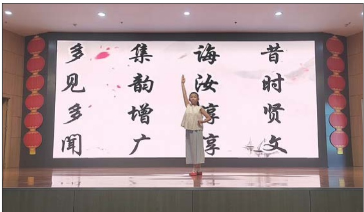
孩子们在国学课堂上进行才艺展示。