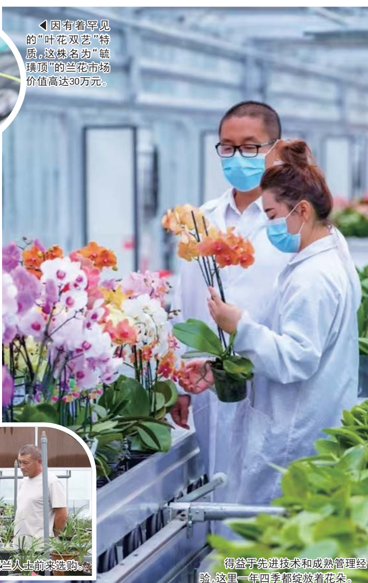
因有着罕见的“叶花双艺”特质，这株名为“毓璜顶”的兰花市场价值高达30万元。