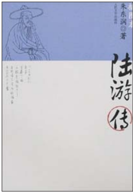
《陆游传》 朱东润 著 人民文学出版社