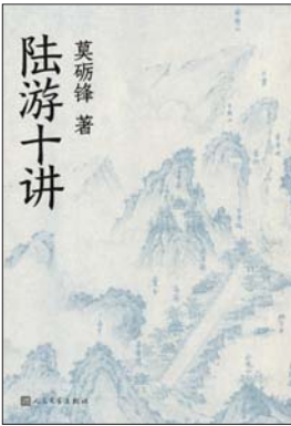
《陆游十讲》 莫砺锋 著 人民文学出版社