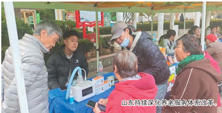
山东持续深化养老服务体系改革。

面对总量大、增速快、高龄化的养老挑战,山东持续深化养老服务体系改革,“十四五”以来从政策筑基到服务升级,从设施覆盖到品质提升,构建起一张覆盖城乡、精准高效、温暖贴心的养老服务网络,让“老有所养、老有所医、老有所乐、老有所为”的美好愿景在齐鲁大地变为现实。