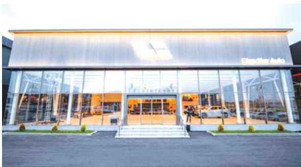
理想汽车阿塞拜疆巴库零售中心。

近日,理想汽车海外业务拓展取得关键突破:继布局乌兹别克斯坦市场之后,理想汽车正式登陆埃及、哈萨克斯坦和阿塞拜疆市场,标志着品牌已完成横跨中亚、高加索地区及非洲的核心市场布局,全球化进程迈入实质性落地阶段。