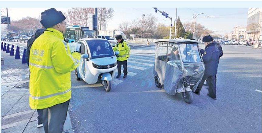
多部门执法人员在禁行路段劝导禁行车辆。

“您好,这里从今天起禁行了,以后三轮车在早上9时之后就不能再进入这个区域了。”现场,交警对每一辆驶入禁行区的三轮车逐一进行拦截,随后,工作人员给