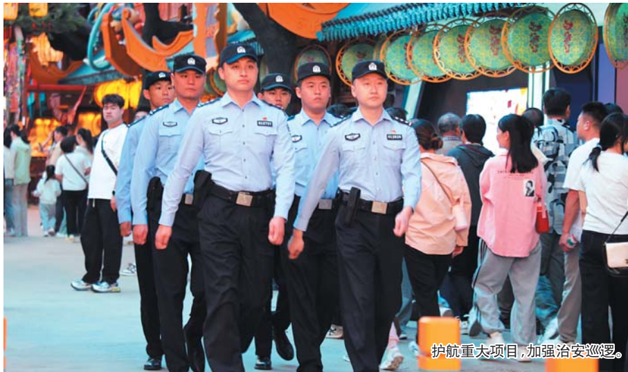
护航重大项目,加强治安巡逻。