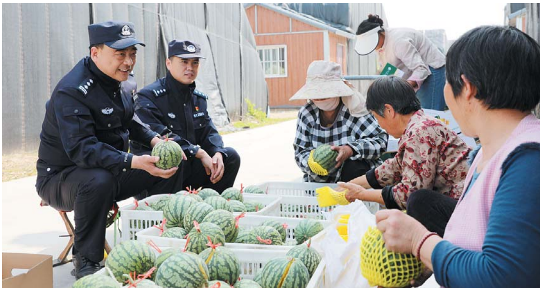
社区民警走访群众。

2025年以来,全区公安机关在区委、区政府和市局党委的有力领导下,以济阳“公安工作提升年”为主线,以“保民安 悦民心”主题行动为引领,全力以赴防风险、保安全、护稳定、促发展,有力维护了济南高质量北部中心城区安全稳定。全区110有效警情同比下降8.6%,刑事、治安警情分别下降8.0%、12.1%,八类严重暴力犯罪案件100%全破,命案、重大事故“零发生”。