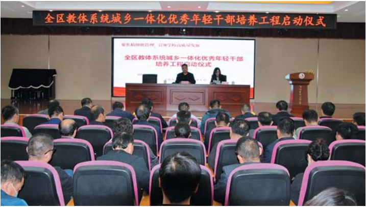
全区教体系统城乡一体化优秀年轻干部培养工程启动仪式。

从校园里的智慧课堂，到运动场上的矫健身影，济阳教育体育事业正在书写着黄河岸边新时代的育人传奇。