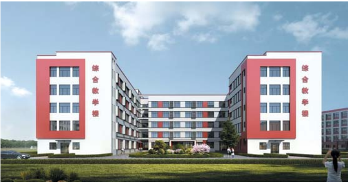
谋划济北中学改扩建。

冬意渐浓，暖意融融。在济阳区，教育体育事业呈现蓬勃发展的新局面。2025年，全区教体系统紧扣民生需求，在资源扩容、质量提升、队伍建设、体教融合四大领域全面发力，交出了一份沉甸甸的民生答卷。