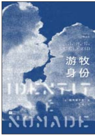
《游牧身份》 [法]勒克莱齐奥 著 张璐 译 后浪 | 江苏凤凰文艺出版社

诺贝尔文学奖得主勒克莱齐奥于2024年推出的新作,以回忆录形式讲述他持续渴望写作的缘由:“作家拥有的行动方式就是写作”,而“文学可以帮助我们抵御时间流逝”。勒克莱齐奥1940年生于法国尼斯,童年恰逢战乱,与母亲、外婆、哥哥在尼斯过着颠沛流离的生活,父亲远在非洲行医,直到十岁时他才得以见到父亲。战后,他随家人乘船前往尼日利亚,此后辗转多地。动荡的成长经历,让他从小就体会到“无根”的漂泊感,却也赋予了他超越常人的广阔视野。他将自己定义为“游牧身份”,如“一条蛇,或是一条鳗鱼,在不同国籍,以及所有这些国籍带来的危险中适时变换”。而这份独特的身份认知,也成为他文学创作的核心源泉。