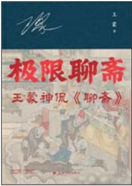
《极限聊斋》 王蒙 著 四川人民出版社

《聊斋志异》不仅是志怪小说的巅峰之作,更是一幅洞察世态人情的生动画卷,蒲松龄以超凡的想象力,构筑了一个人、鬼、狐、妖共存的世界,荒诞与真实交织,成就了中国文学史上的一部奇书。作家王蒙以九十载人生阅历与文学功力,对《聊斋志异》展开一场酣畅淋漓的“神侃”式解读。鬼狐有性格,笑骂成文章,纵横通今古,天地共炎凉。他从蒲松龄的原著中精选《考城隍》《王成》《聂小倩》等五十余篇经典故事,以小说家的敏锐洞察力,进行充满自由联想与个性色彩的再创作。他一边以生动口语重述故事,一边犀利评点,在古典叙事与当代生活之间架起一座通畅的桥梁。