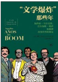
《“文学爆炸”那些年:加西亚·马尔克斯、巴尔加斯·略萨和那群改变世界的朋友》 [西]哈维·阿延 著 侯健 陈华 译 生活·读书·新知三联书店

尽管没有纪念标牌,可20世纪西班牙语文学界最重要的文学运动——拉丁美洲“文学爆炸”——正是在1967年至1976年间于巴塞罗那爆发的。本书以详实的采访和档案材料,记录了20世纪60年代至70年代“文学爆炸”时期的重要作家(如加西亚·马尔克斯、巴尔加斯·略萨、富恩特斯、科塔萨尔等)如何崭露头角,及其背后的文化、政治与出版业故事。为撰写此书,作者哈维·阿延赴墨西哥城、布宜诺斯艾利斯、哈瓦那、巴黎和纽约,进行了长达十年的调研,参阅了300多份鲜活的文献资料。书中不仅包括作者对“文学爆炸”核心人物的访谈,还包括许多迄今为止鲜为人知的材料,更披露许多未曾公开的材料与一段群体记忆中的生动逸事。