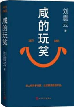
《咸的玩笑》 刘震云 著 人民文学出版社

每月月末或月初,本榜单从最新出版的文学艺术、历史传记、思想社科类图书中,参考图书网店的数据及专业书评媒体的评价,以人文性、思想性、趣味性为标准,筛选出一本重点推荐图书和九本好书,期待其中的某一册能够进入您的内心。