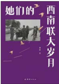
《她们的西南联大岁月》 郑绩 著 浦睿文化 | 团结出版社

西南联大是一段教育传奇。如果说学术成就与精神高度是西南联大的A面,那么种种实务之艰难、生存之困苦,便是其B面。而其间教授太太这一群体的身影,却在后世书写中渐渐模糊,成为被“家属”标签遮蔽的碎片。她们中有翻译家、文学家、演员、科学家、教师,也有奋力支撑家庭与学校运转的主妇,皆以各自的方式回答如何度过生命里的艰难时刻。本书作者精研史料,重现教授太太们的生活与故事。她们的选择或重大或日常,渲染着联大的风气,映照着实知识界对国家未来的设想,诠释了文明存续中牺牲与奉献的意义。在朝不保夕的日子里,她们始终努力保全家庭生活,以及自我的精神世界。