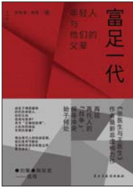
《富足一代》 伊险峰 杨樱 著 理想国 | 民主与建设出版社

本书通过对多位1995年—2005年间出生的年轻人及其父辈的访谈,描摹每个人的成长之路,以及他们对他人、对世界的看法。相较于父辈,这些年轻人成长于物质富裕、互联网高度发展的时代,娱乐文化、便捷服务与海量信息触手可及,他们对“正确的选项”的理解,也与父辈颇为不同。本书大部分篇幅聚焦于“富足一代”对自我身份的判断与处事方式,以及他们与父母、学校、社会观念的关系和冲突;另一部分则聚焦于父辈,他们如何认知自己与世界的关系,如何看待和教育下一代。通过两代人的真诚自剖,本书试图探究在不同时代背景下,人们是如何认识这个世界的,以及商业、科技、媒介、娱乐文化等方面的变化对“富足一代”产生的深刻影响。