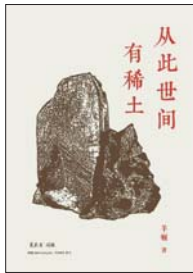
《从此世间有稀土》 羊顿 著 湖南科学技术出版社

如今被各国争夺的战略资源稀土,最初只是十八世纪欧洲实验室里无人在意的石头。1787年,瑞典炮兵中尉卡尔·阿克塞尔·阿雷纽斯在伊特比矿场发现了一种带有玻璃光泽的黑色矿石,并寄给了化学家好友约翰·加多林一块——这一无心之举开启了绵延160年的稀土元素发现史。本书以文字为显微手段,精细描摹数十位科学家发现十七种稀土元素的故事:分离15000次,只为制得一丁点纯净样品;即使是伟大的科学家,面对全新的理论,也可能很保守;物理学、工程学的进步如何推动化学的发展;为了优先权,科学家也会争得面红耳赤……这不仅是一部稀土元素发现史,还是一部以稀土科学家为主角的历史非虚构作品,“有的灵光一闪,做出自己的贡献便拂衣而去;有的在泥泞中挣扎一生,最终也难以在科学大厦上刻下自己的名字。耀眼也好,平凡也罢,个个中滋味艰辛还是甜蜜,唯有自知”。