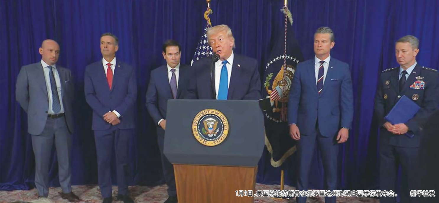
1月3日,美国总统特朗普在佛罗里达州海湖庄园举行发布会。

据美媒报道,委内瑞拉反对派认为2024年总统候选人之一、目前流亡西班牙的冈萨雷斯是合法总统。委反对派领导人马查多上月表示,冈萨雷斯已邀请她担任副总统,她在为马杜罗下台后的“有序和平过渡”做准备。