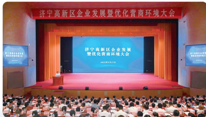
济宁高新区营商环境大会。

从教育均衡的“学有所优”,到就业稳定的“劳有所得”,从医疗便捷的“病有所医”……未来,济宁高新区将在产业升级与民生保障的双向奔赴中,不断书写各美其美、美美与共的民生新篇,让高质量发展的成果更多更公平惠及全体群众。