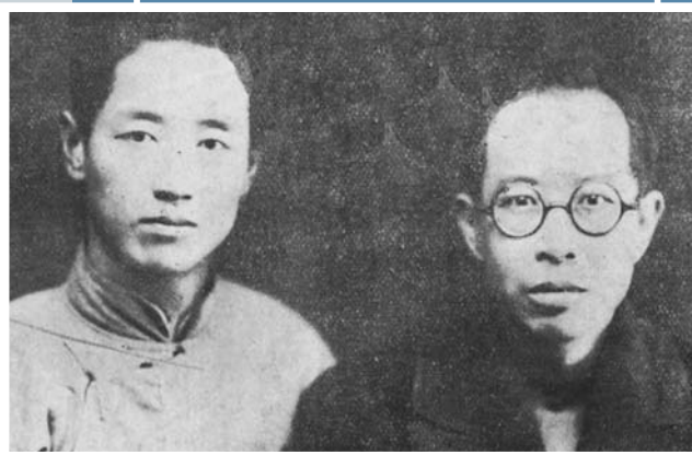
1935年王统照(右)与臧克家(左)摄于上海。

王统照虽然在山东大学任职不长,但他和一大批曾在山东大学任教的著名教授,如闻一多、老舍、梁实秋、洪深、陆侃如、冯沅君以及其他学者教授一起,使这一齐鲁文化之邦的高等学府更加名扬中外。王统照主持山大中文系工作后,提倡厚今薄古,古为今用,在加强文史教学,突出文史特长方面,做了有益的工作。