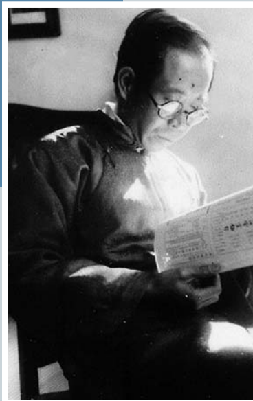
上世纪30年代王统照在青岛家中书房。