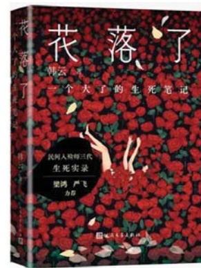
《花落了：一个大了的生死笔记》 韩云 著 人民文学出版社