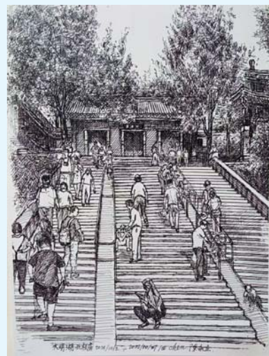
陈永立画的大明湖北极庙。