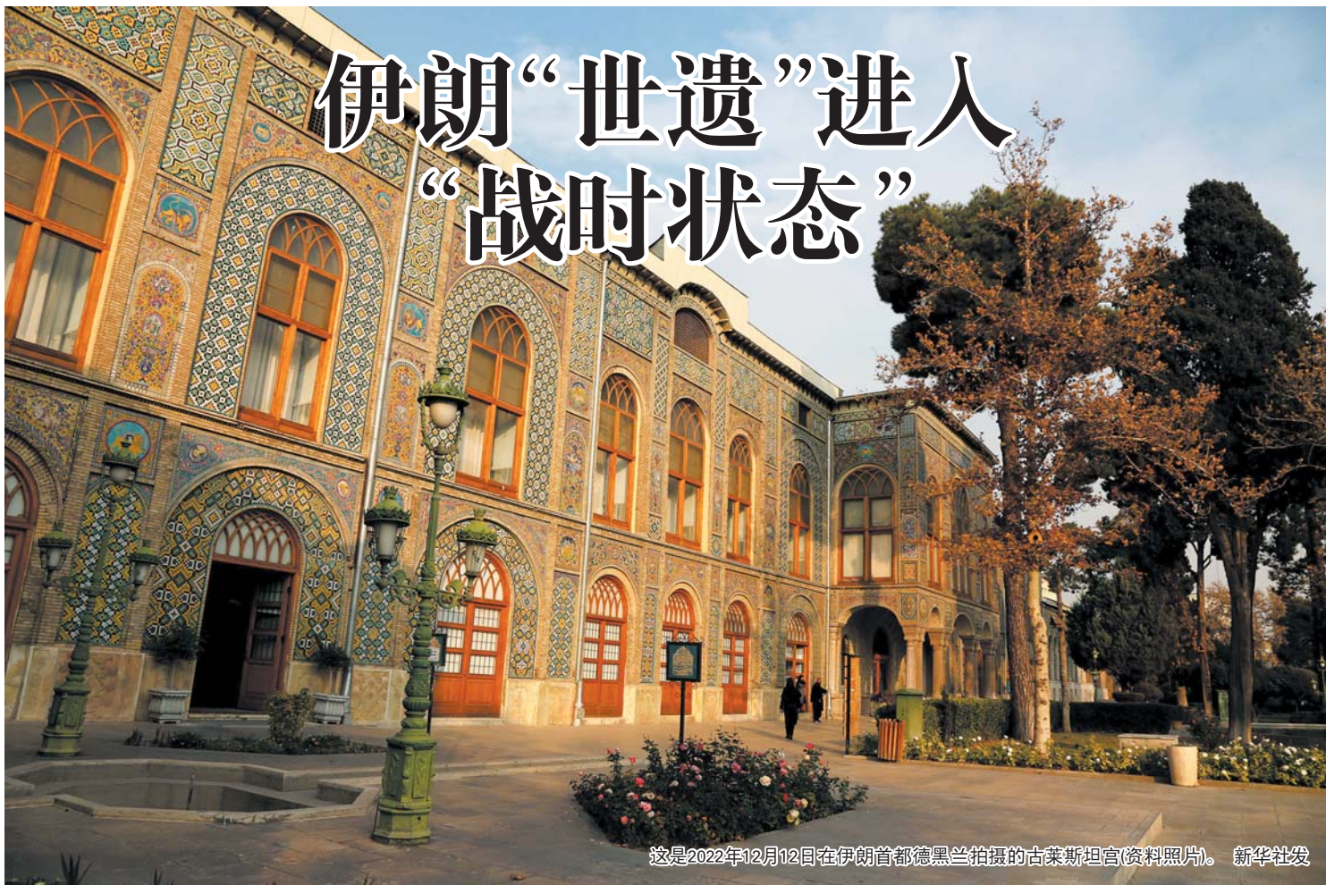
这是2022年12月12日在伊朗首都德黑兰拍摄的古莱斯坦宫(资料照片)。

自美以对伊朗发动军事打击后，伊朗的世界遗产笼罩在战火阴影之下。3月10日，伊朗外交部发言人巴加埃表示，继世界文化遗产古莱斯坦宫(又称“玫瑰宫”)在美以袭击中受损后，位于伊斯法罕的四十柱宫也在袭击中受损。此前，美国总统特朗普在其第一任期期间就曾威胁要攻击伊朗的文化遗址。那么，这次伊朗的世界遗产能躲过一劫吗？