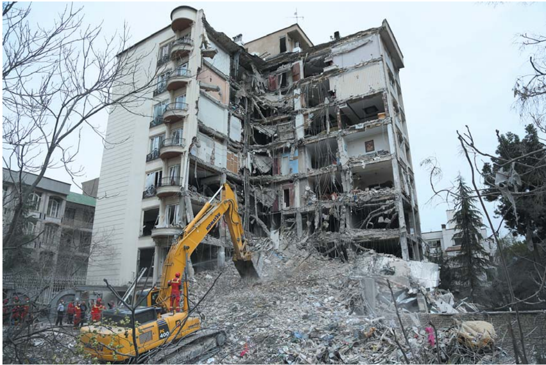
这是3月23日在伊朗德黑兰一处居民区拍摄的被毁建筑，该居民区曾在美以军事行动中遭受袭击。

伊朗媒体25日援引一名伊朗高级官员的话报道说，伊朗拒绝了美国提出的停战方案，并提出伊方关于停战的5项条件。同一天，美媒报道称，美国总统特朗普近日向其顾问表示，他希望“快速”结束对伊朗战争，力争“在未来数周”终结战事。