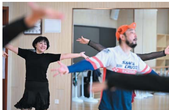
学员们都很喜欢上他的课，课堂上欢声笑语，严肃而又活泼。