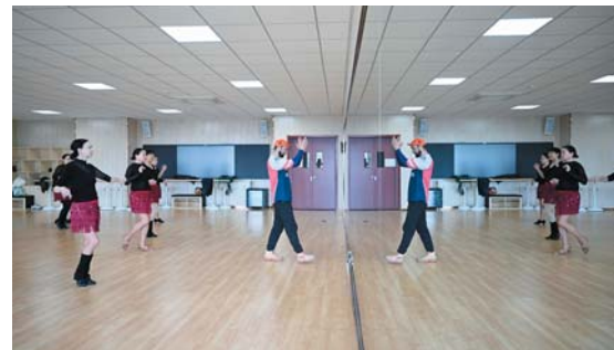
偌大的舞蹈教室里，激情澎湃的舞步和音乐让人停不下来。