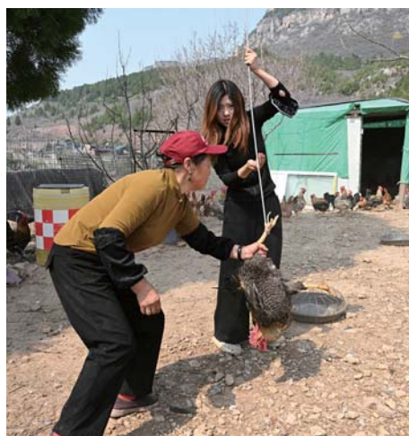
跑山鸡不好抓,需要婆媳两人配合。