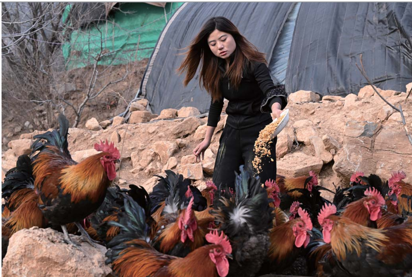
吃粮食长大的跑山鸡毛色光亮特别漂亮。