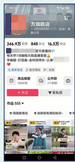
多家编程机构的宣传中,会营造出“学编程就能成为科技特长生”的错觉。