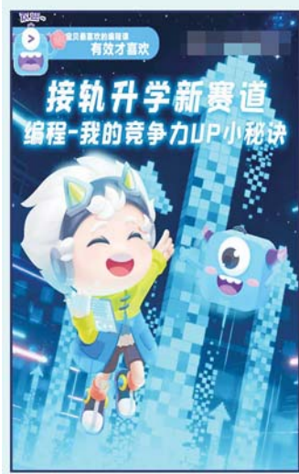
多家机构的招生宣传中,都将“学编程”和“升学”刻意挂钩。