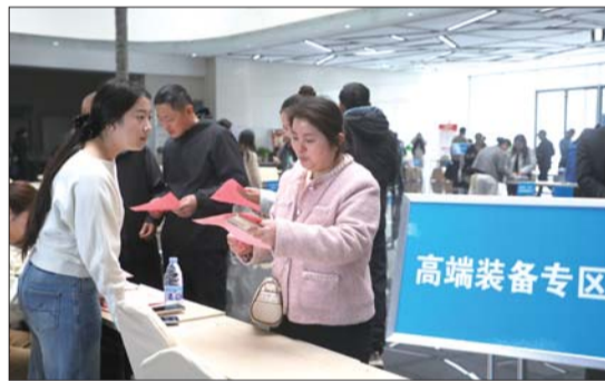
招聘企业、求职者现场交流。

招聘现场秩序井然、气氛热烈，各企业招聘人员热情地向求职者介绍企业概况、岗位要求、薪资待遇和发展前景，求职者与企业工作人员面对面交流洽谈，积极寻求适合自己的就业岗位。“研发工程师的岗位有哪些要求？”“质量检验员需要哪些专业？”“这个岗位的一月工资是多少？”在山东瑞城宇航材料有限公司的招聘展位前，不少求职者正在咨询。