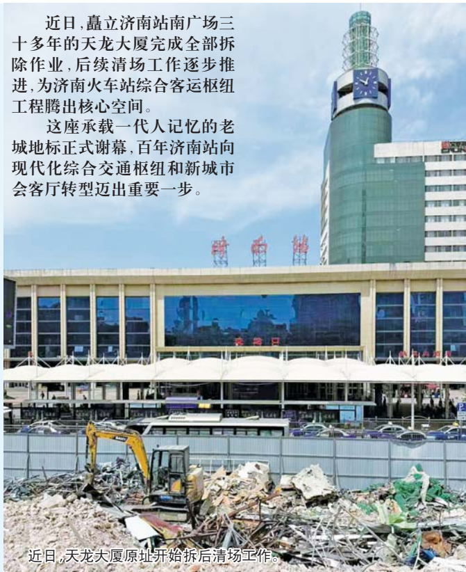
近日，天龙大厦原址开始拆后清场工作。

这座承载一代人记忆的老城地标正式谢幕，百年济南站向现代化综合交通枢纽和新城市会客厅转型迈出重要一步。