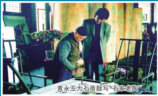
黄永玉为石盾题写“石家老陶”

早些年,山东美术界有一个绕不过去的名字,这便是版画家、工艺美术家、鲁砚定名与研发者石可(1924—2006)。他以版画之眼洞察陶土,不仅为鲁砚定名立说,更历时多年成功复原鲁柘澄泥砚烧制技艺。从版画、鲁砚到“石家老陶”,石家两代人共同铸就了一段从传统陶艺到文化创新的赓续传奇。