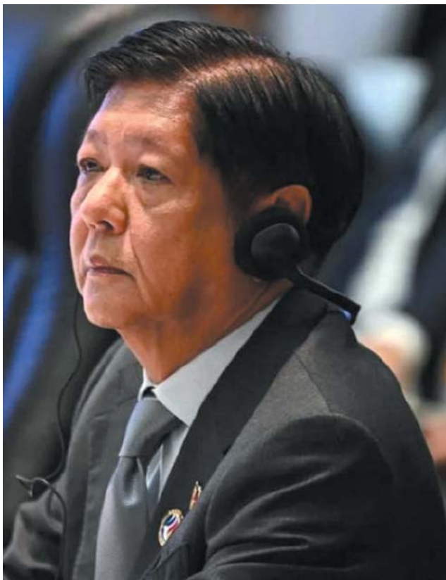
菲律宾总统马科斯