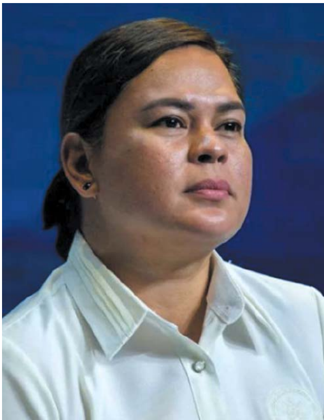
菲律宾副总统莎拉·杜特尔特