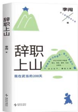
《辞职上山:我在武当的200天》 李闯 著 新经典文化 | 新星出版社

患有焦虑症的人类学硕士李闯辞去出版社编辑工作,开了一家小卖部,却发现即便离开了职场,生活依然一团糟。“来武当山吧!在武当山做义工,每天的生活就是在扫完地、喂完猫之后,听道长吹吹笛子,自己看看云彩、发呆,反正今天也不能提前扫明天的地嘛。”一位朋友的邀请改变了他人的人生轨迹,报名成功后,他立即上山,成了一名武当山义工。