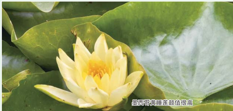
墨西哥黄睡莲颜值很高