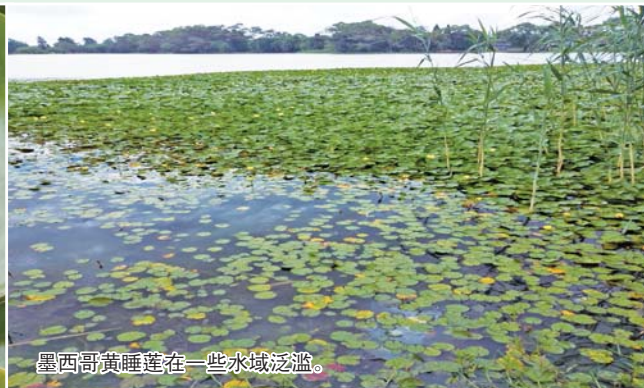
墨西哥黄睡莲在一些水域泛滥。