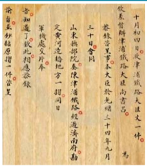
▼外务部关于津浦铁路的文件