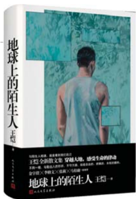
王恺著 《地球上陌生人》 人民文学出版社