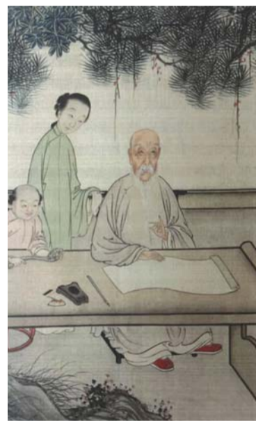
▲ 清代画家尤诏《汪恭《袁枚十三女弟子湖楼请业图》卷中的袁枚，上海博物馆藏。

肖像画的滥觞，最早可追溯到汉代，但有作品传世，则至少要到两宋时期。明以前的肖像画，多以独立的个人形象为主，较少衬景。明清以后，出现多元化的表现形式，如合像、群像和以山水为背景的行乐图等模式。清代，文人个性化肖像出现前所未有的兴盛，其形象的不同表达与传播是像主影响力的缩影。《如见其人：明清文人肖像的形塑与多重呈现》所录图像，大多来自中国国家博物馆藏品，有不少肖像画乃首次公开露面。这些兼具艺术性、学术性与文献价值的肖像画，为认识明清时期艺术的递变与接受有着重要的佐证意义。