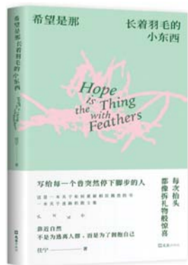
《希望是那长着羽毛的小东西》 任宁 著 新经典文化 | 文汇出版社