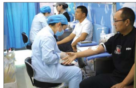
现场群众参与献血。

“今年世界献血者日主题为‘一滴热血,一份爱心,无偿献血,挽救生命’。一直以来,济宁市高度重视无偿献血工作,持续完善献血服务体系,优化献血环境,强化宣传引导,越来越多的市民主动加入无偿献