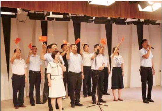
▲图为第一、第三、第六纪检监察室，及金山、文登营镇、界石镇、宋村镇纪委联合演唱歌曲《我的中国心》。

6月25日上午，为迎接建党98周年华诞，区纪委监委退休党支部组织老党员到乳山市石马山教育基地和胶州育儿所接受红色教育，缅怀革命先烈，感悟革命精神。