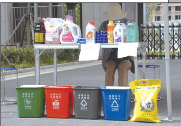
▲在铂悦府小区内,工作人员定期组织积分换礼品的活动,这大大提高了居民垃圾分类的积极性,且在领取礼品的同时,可以再次深入学习垃圾分类的相关知识。