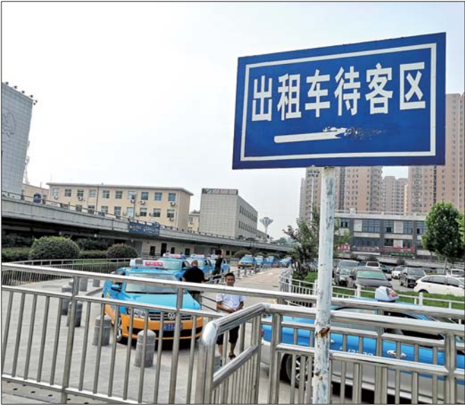
单行道入口秩序井然。

在火车站前广场南区,齐鲁晚报齐鲁壹点记者看到,广场南入口处,便是出租车专用车道,单排进出,环道等候,进入出租车待客区。在出租车待