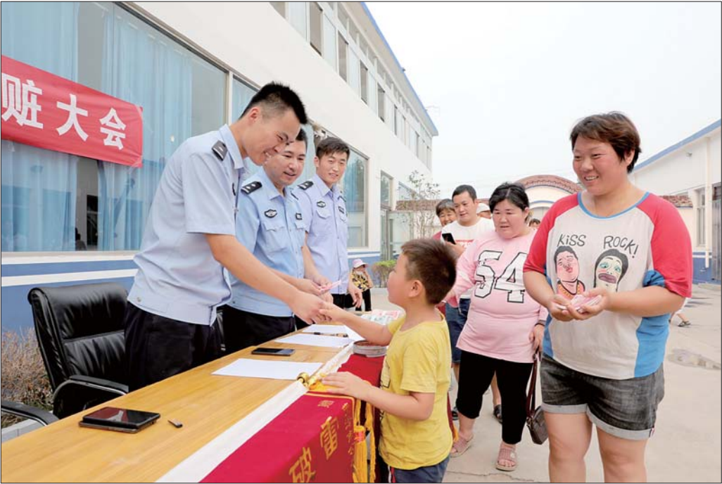
退赃中,一名小朋友向民警敬礼,感谢民警帮他妈妈追回被骗钱财。

据犯罪嫌疑人供述,他听说开中医药门诊挣钱多、来钱快,就在何楼办事处彭拐村租了一家门市,以“祖传秘方”贴膏药、吃药丸、喝药酒等方式治疗肩周炎、风湿病、腰腿疼痛、