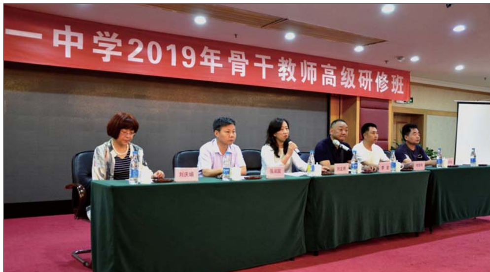
济宁一中2019年骨干教师高级研修班开班仪式现场。

本报济宁7月31日讯(记者 姬生辉) 7月15日—19日,济宁一中组织120名骨干教师奔赴位于吉林长春的东北师范大学,进行了为期5天的学习培训。培训中,来自东北师范大学的专家教授受邀前来作了精彩的讲座,并与教师们进行交流互动。本次培训,提高了参训教师的教育理念和创新能力,开阔了眼界,促进了新高考背景下施教水平的提升。