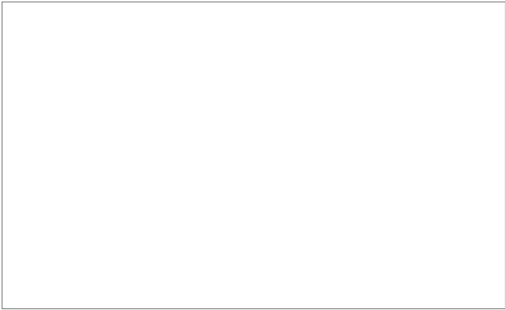
胡茂村举办摸鱼节，摸到大鱼的游客心里乐开了花。

一个缩影。近年来，胡茂村人发展以东方园林为龙头的苗木产业，增加村集体的收益，同时也解决了村里一部分人的就业问题，让村民不出村就把工资领到了手。依靠苗木资源这个优势，通过土地流转，村民不仅能得到每亩1000余元的土地流转金，剩余劳动力还能到基地务工增加收入，传统农民在家门口就成了农业产业工人。