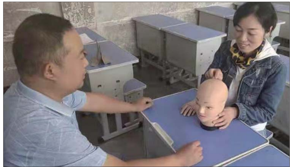
乡村医生业务水平测试现场。

本报济宁9月24日讯(记者 邓超 通讯员 刘越) 日前,济宁高新区接庄街道2018至2019年度乡村医生考核业务水平测试在高新区第四小学举行。本次测试共计有102名在岗乡村医生参加了考试。