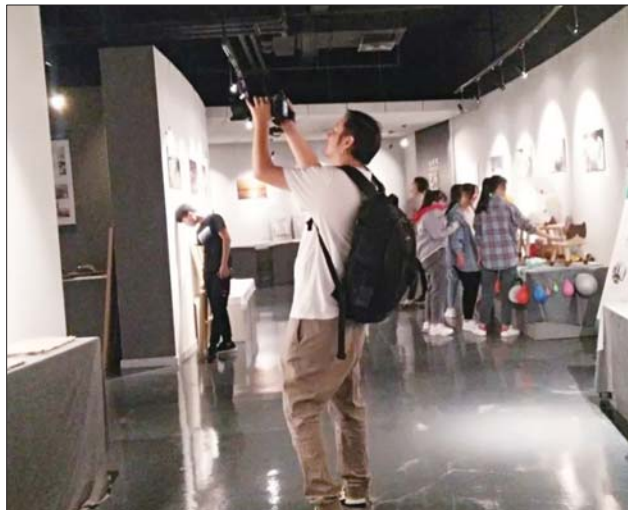
作品展吸引来诸多摄影爱好者。

据了解,本次作品展,是把课程教学融入实践的举措结果,体现了大学园注重专业教学与文化支撑,注重课程文化内涵与文化遗产的育人特色。通过本次活动,提高了大学园区学生艺术创作的积极性,同时也为大学园区学生专业技能的提高创造了更好的条件。