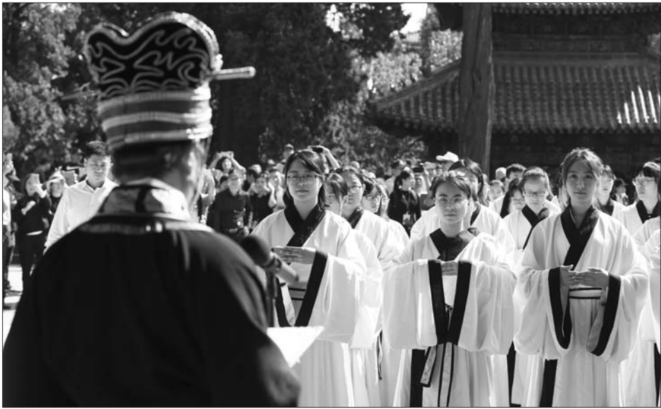
参与研学游的学子在孔庙内举行成人礼。

徜徉在孔庙、孔府和孔林,参加孔子礼仪课堂、《论语》背诵,参与晨钟暮鼓和祭孔展演,体验中华民族的审美情趣,在浓厚的文化氛围中感受传统文化,到曲阜研学已经成为学生群体中的一种新时尚。