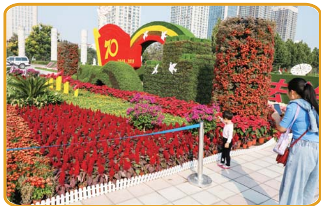
新世纪广场上漂亮的园林造型。