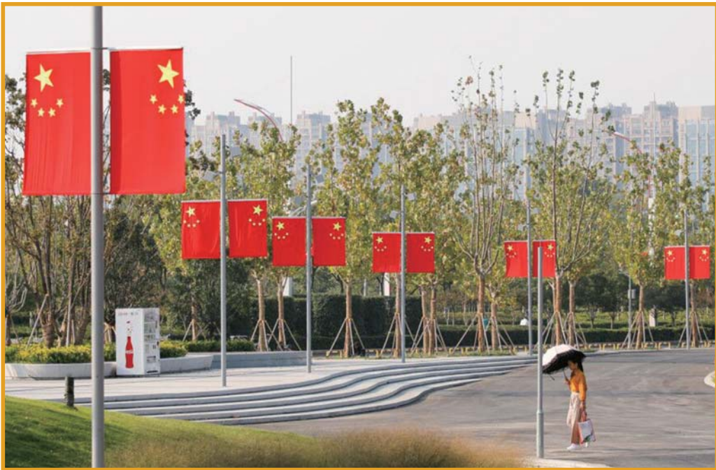
济宁市文化中心内,路灯灯杆上挂上国旗。