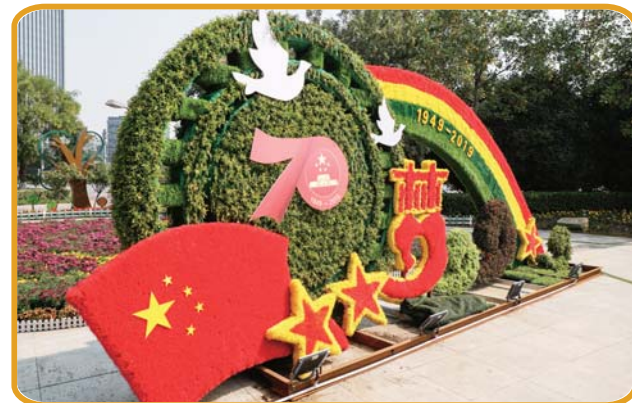
蓼河公园内,喜迎国庆的园林造型。