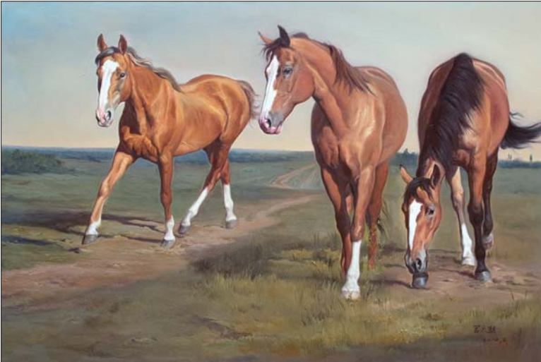
▲原上之路 120x80cm 宫六朝

此次展览的题材主要以风景为主,飞奔的骏马,溪边饮水的老牛、白雪、远山,生活气息浓郁,却又不失诗情与浪漫。现场有位观众驻足许久,他对记者表示,走进宫六朝的艺术展区,处处闪烁着人本心性中的率真与恬静,漫步于他的油画雪景创作中,体味寂静的大自然,冰雪玲珑的白色世界,遂还原了心灵中那纯朴的空间。他描绘的动物形态生动、逼真,散发着浓郁的乡情,也颇有暖暖的人间烟火气息。