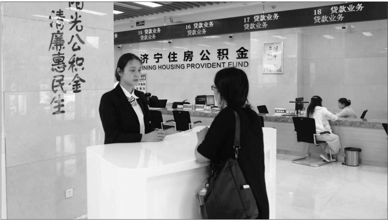
市民咨询办理公积金业务。

日前,《济宁市住房公积金提取管理办法(征求意见稿)》(以下简称《征求意见稿》)正在公开征求意见,这意味着济宁市住房公积金提取政策将作调整。涉及购房提取、还贷提取的范围、频次及异地购房提取和还贷等方面。