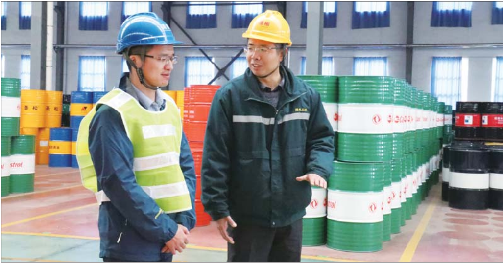
专业干部“一对一”定点帮扶重点企业。

“服务特派员”制度的建立是进一步加强高新区管委会和企业间的互动,提高为企业服务的精准度和服务效能,打造“亲不逾矩,清不疏”新型政企关系的重要举措。经过三年努力,实现“151”工作目标,即累计服务重点骨干领军企业100家,行业细分领域成长冠军企业500家,辐射带动高成长性科技中小企业1000家,为高新区实现新旧动能转换和创新发展提供强大支撑。